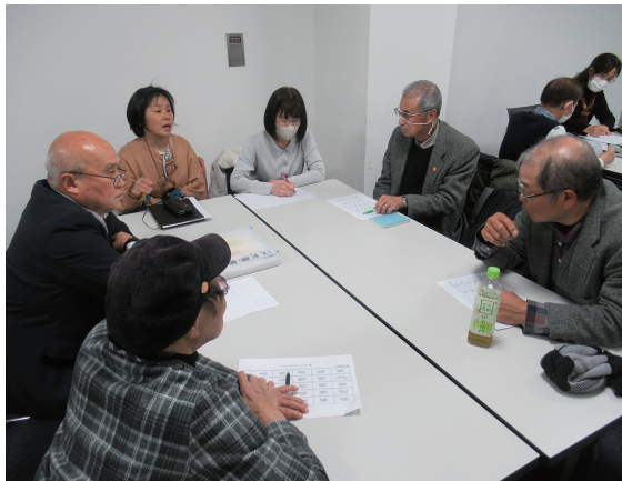
フリーディスカッション

昼食をはさんで3コマ目は、フリーキーキングとして、5名のグループに分かれて研修会の振り返り等、それぞれのテーマを決めてのフリーディスカッションを行いました。